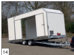
14 Optional: disponibile box van, varie misure, vari allestimenti, porte laterali,ecc.