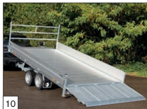
10 Optional: sponde in alluminio h.cm.30 e supporto scala anteriore.