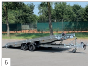
5 Standard: sospensioni paraboliche con balestre ed ammortizzatori, per rimorchi con portata kg.3500 e lunghezza mt.4,50 e mt.5,05.