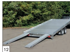
12 Optional: pianale integralmente in alluminio, rampe alluminio l.2500 mm posizionate sotto il piano di carico.