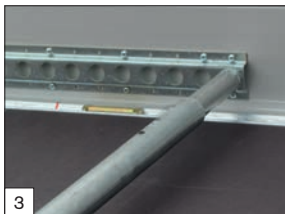
3 Optional: barra ferma carico registrabile.