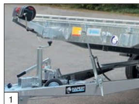
1 Standard: pompa idraulica a doppio effetto, ringhiera combi protect rail perimetrale