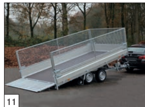
11 Optional: sovra sponde a rete zincate laterali h.cm.75.