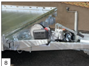
8 Standard: argano e supporto argano installato.