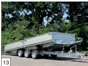
13 Optional: versione a 3 assi disponibile per lunghezze mt.4,55 / 5,05.