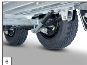
6 Optional: sospensioni paraboliche non disponibili per versioni lunghe mt.4,05.