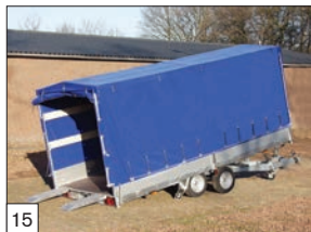
15 Optional: centina e telo, varie altezze, colore standard grigio.