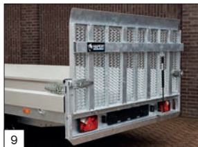
9 Standard: rampa unica posteriore grigliata dotata di 2 molle a gas di richiamo.