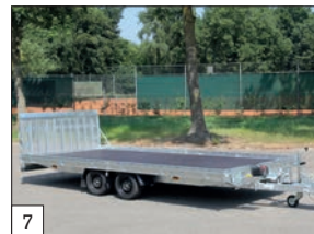
7 Standard: ruote 195/50R13C e cerchi neri di serie per versione con sospensioni paraboliche mt.4,50 - 5,05.