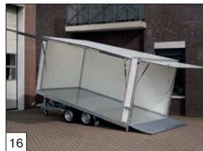
16 Optional: con la versione box van, disponibili porte laterali apribili e rampa posteriore.