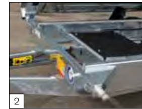
2 Standard: pompa elettrica di serie con batteria.