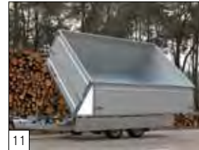
11 Optional: sovra sponde alluminio 700 mm apribili con attacco superiore.