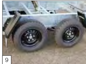
9 Standard: cerchi colore nero, in uso con il package sospensioni paraboliche.