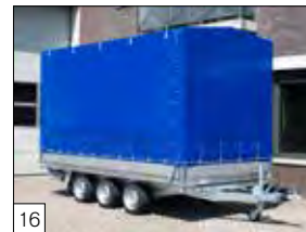
16 Optional: versione a 3 assi con centina e telo, colore grigio standard.