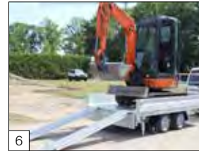
6 Optional: 'DRIVE-ON' package: coppia rampe da 2500 mm installate sotto il piano di carico, coppia piedini posteriori rinforzati telescopici e girevoli a 90°.