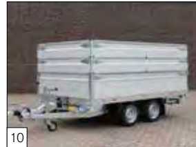
10 Optional: sovra sponde in alluminio da 300/400 mm.