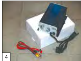
4 Optional: carica batteria.