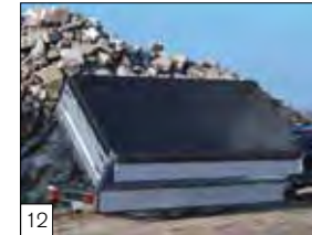
12 Optional: sponde apribili con attacco superiore, e rete ferma carico a maglia fine.