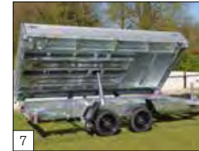
7 Optional: 'DRIVE-ON' package in aggiunta alle sospensioni paraboliche.