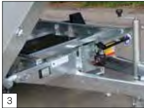
3 Optional: pompa manuale di emergenza installata in aggiunta alla pompa elettrica.