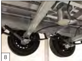
8 Optional: sospensioni paraboliche, balestre ed ammortizzatori.