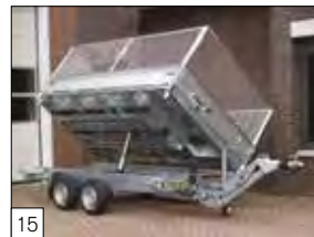
15 Optional: timone regolabile in altezza.