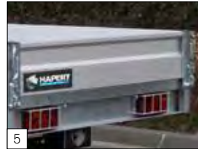
5 Optional: protezione fanali).