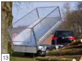
13 Optional: sovra sponde in rete zincata h.700 mm.