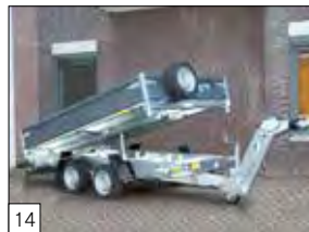
14 Optional: sponde in acciaio verniciate (disponibili solo su modello FERRO ).